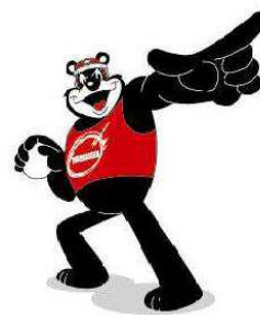
昭和新山国際雪合戦マスコットキャラクターブラッキー